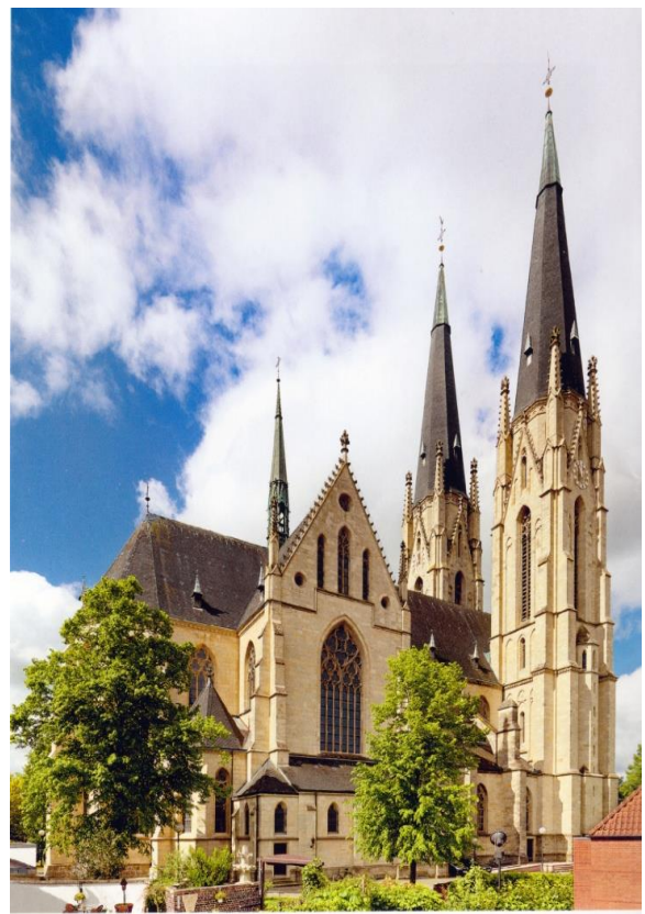
Blick auf den Ludgerusdom von Norden

Von hier ging es weiter zum Ludgerusdom mit seinen 2 fast 100 m hohen Türmen. Das mächtige Gotteshaus wurde 1892-1898 in Form einer neugotischen Basilika erbaut. Die Kirche steht an der Stelle, an der nach der Überlieferung der heilige Liudgerus am 26. März 809 gestorben ist. Im Südturm befindet sich die Sterbekapelle des heiligen Liudger. Dr. Eynck konnte uns alle Einzelheiten sowohl über die Johanniskirche als auch über den Ludgerusdom erzählen. Mit einem Bummel durch die Altstadt ging es zurück zum Bus.